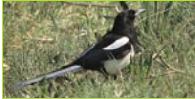
Elster Pie bavarde