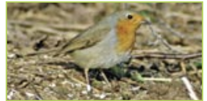
Rotkehlchen Rouge-gorge familier