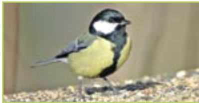
Kohlmeise Mésange charbonnière