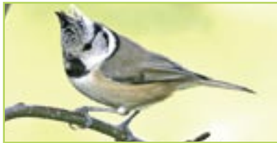
Haubenmeise Mésange huppée