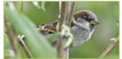
Haussperling Moineau domestique