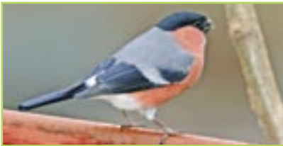
Gimpel Bouvreuil pivoine