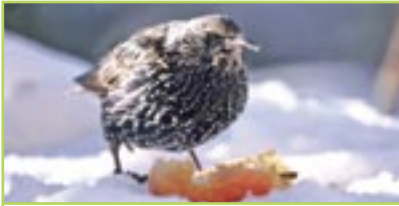
Star Etourneau sansonnet