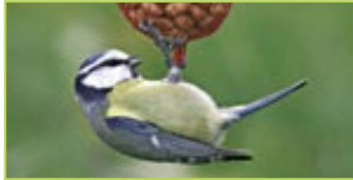
Blaumeise Mésange bleue