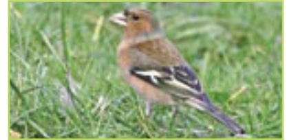
Buchfink Pinson des arbres