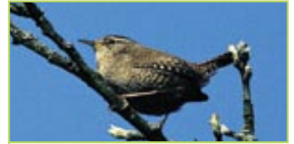
Zaunkönig Troglodyte mignon