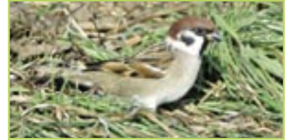
Feldsperling Moineau friquet