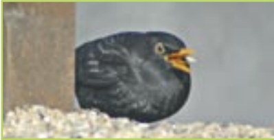
Amsel Merle noir