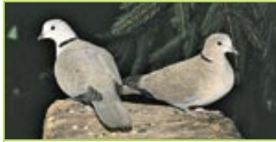
Türkentaube Tourterelle turque