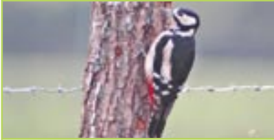
Buntspecht Pic épeiche