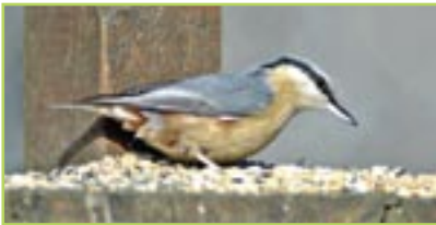
Kleiber Sittelle torchepot