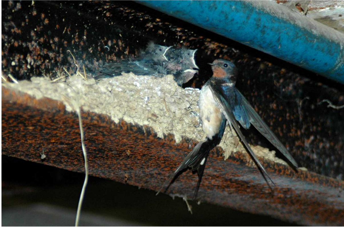
Hirondelle rustique au nid (Gilles Biver / LNVL)